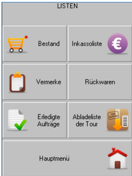
Druck von Belegen/Listen